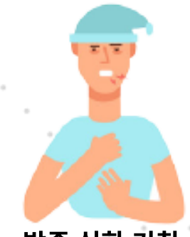
밤중 심한 기침