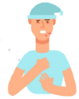
Ho vào ban đêm