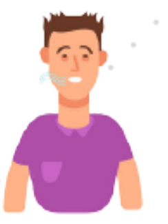
Thở khò khè